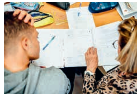
Bildung für mehr Chancengleichheit

Die Caritas Lerncafés bieten Schüler*innen im Alter von 6-15 Jahren aus bildungsfernen und sozial benachteiligten Schichten kostenlose Lern- und Nachmittagsbetreuung an. Im Rahmen seines 75-jährigen Bestehens startet das Wirtschaftsprüfungs- und Beratungsunternehmen KPMG eine Kooperation mit Caritas Österreich, um Bildungsprojekte zu fördern. Mit der Spendensumme von 75.000 Euro schafft KPMG weitere Chancen für Kinder und Jugendliche in den Lerncafés und ebnet so den weiteren Bildungsweg für viele benachteiligte Schüler*innen. Vielen Dank!