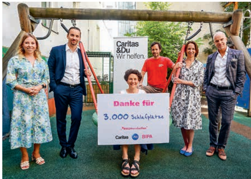
Gemeinsam für Mütter in Not

Zwischen dem 21. April und 18. Mai sammelten die langjährigen Caritas-Partner mit der Unterstützung zahlreicher Konsument*innen Spendengelder für die Caritas Mutter-Kind-Häuser in Österreich. Damit konnte erneut das Spendenziel von 100.000 Euro erreicht werden. Ein herzliches Dankeschön hierfür!