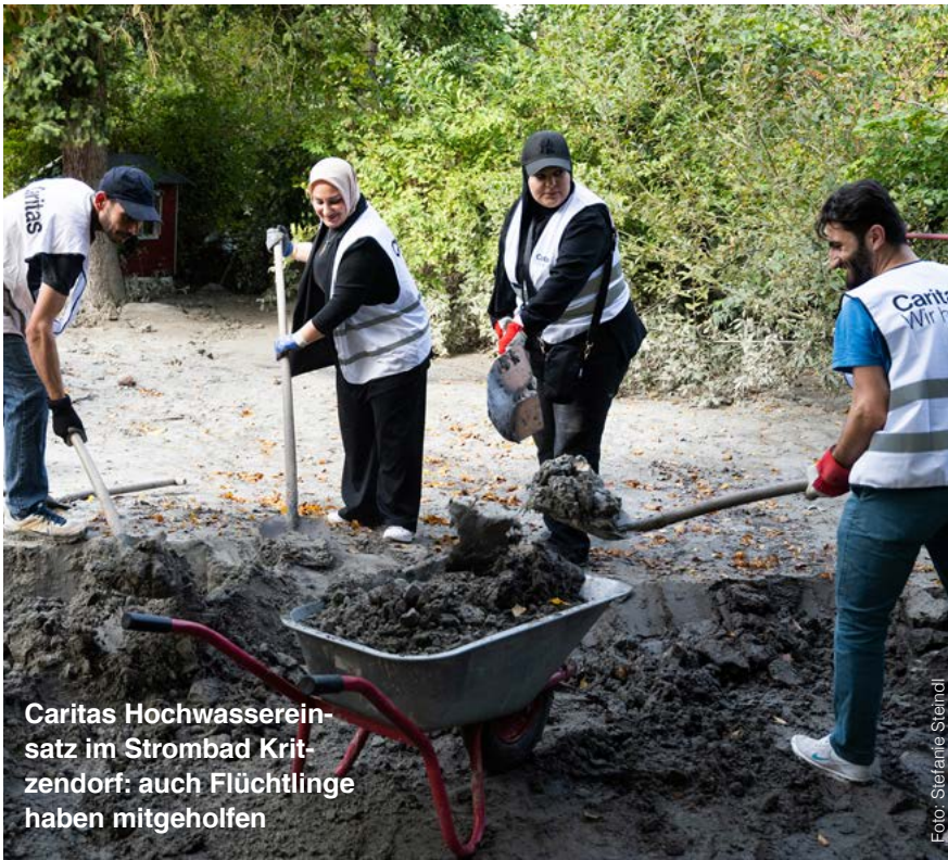
Caritas Hochwassereinsatz im Strombad Kritzendorf: auch Flüchtlinge haben mitgeholfen