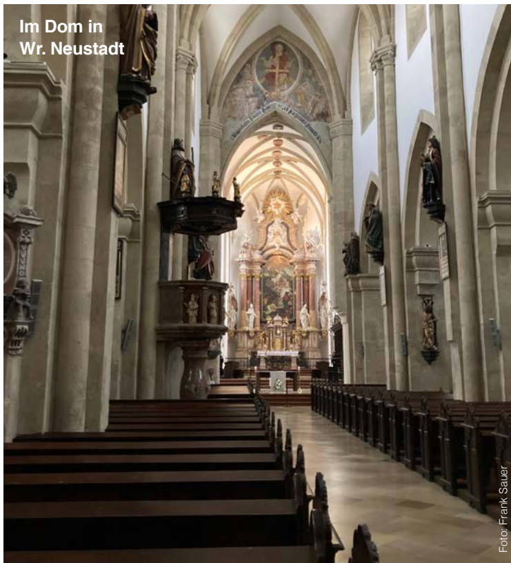
Im Dom in Wr. Neustadt