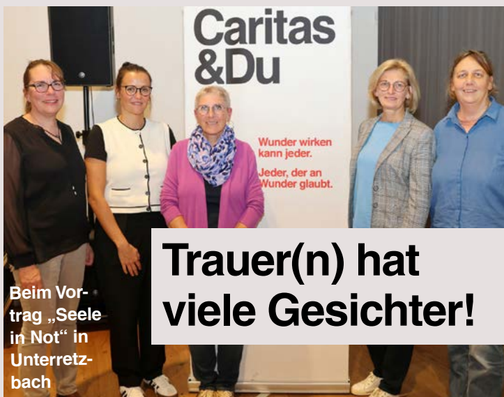
Beim Vortrag „Seele in Not“ in Unterretzbach

In den Therapiegruppen haben die Teilnehmer*innen die Möglichkeit,