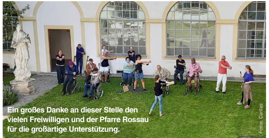
Ein großes Danke an dieser Stelle den vielen Freiwilligen und der Pfarre Rossau für die großartige Unterstützung.